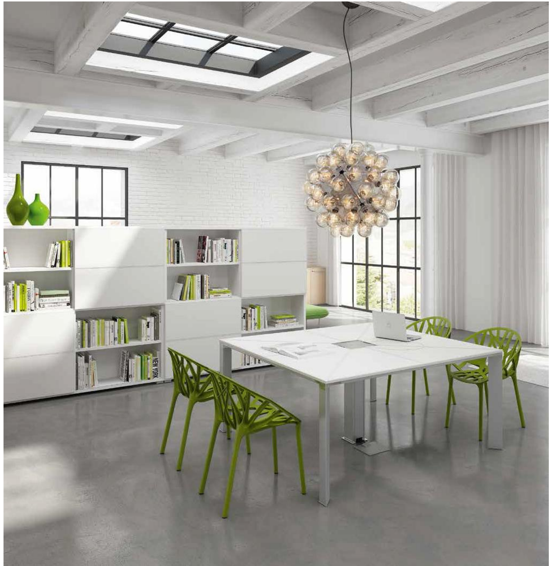
Composition of a square table with central top access and bookshelves with sliding doors. All in white leather.